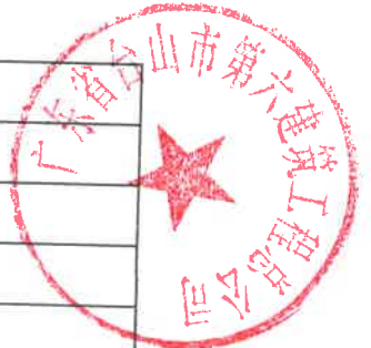
表5 A1-8 (季度建筑业产值从高到低排名, 31-50名且实现正增长的)